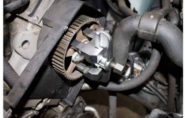
ABZIEHER NOCKENWELLENRAD 121108, 121107, 121106