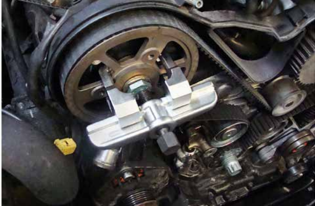
ABZIEHER NOCKENWELLENRAD 121108, 121107, 121106