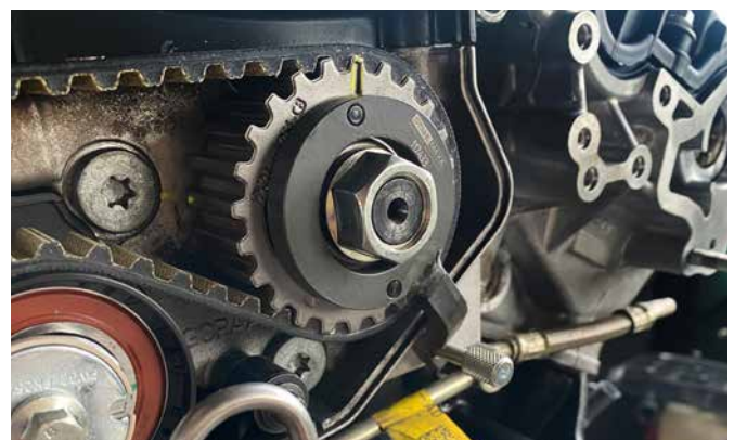
ZUSATZWERKZEUG KRAFTSTOFFPUMPE 117433