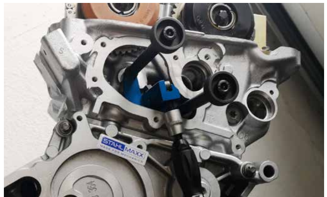
VORSPANNWERKZEUG FÜR STEUERKETTE