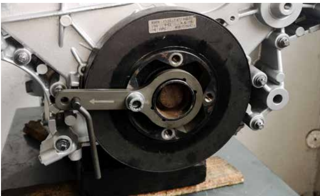
AUSRICHTWERKZEUG, ABSTECKDORN FÜR KURBELWELLE